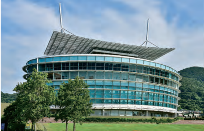
関門海峡ミュージアム 外観