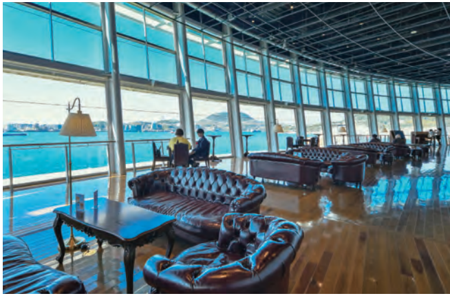
プロムナードデッキ

なく、耳をすませば人々の会話やバナナの叩き売りの調子も聞こえてきます。他にも施設内には、小さな子どもも楽しめる「海峡こども広場」があります。高さ10mの青いスロープネット遊具空間は、1歳以上から利用ができ、子どもたちに大人気の場所となっています。